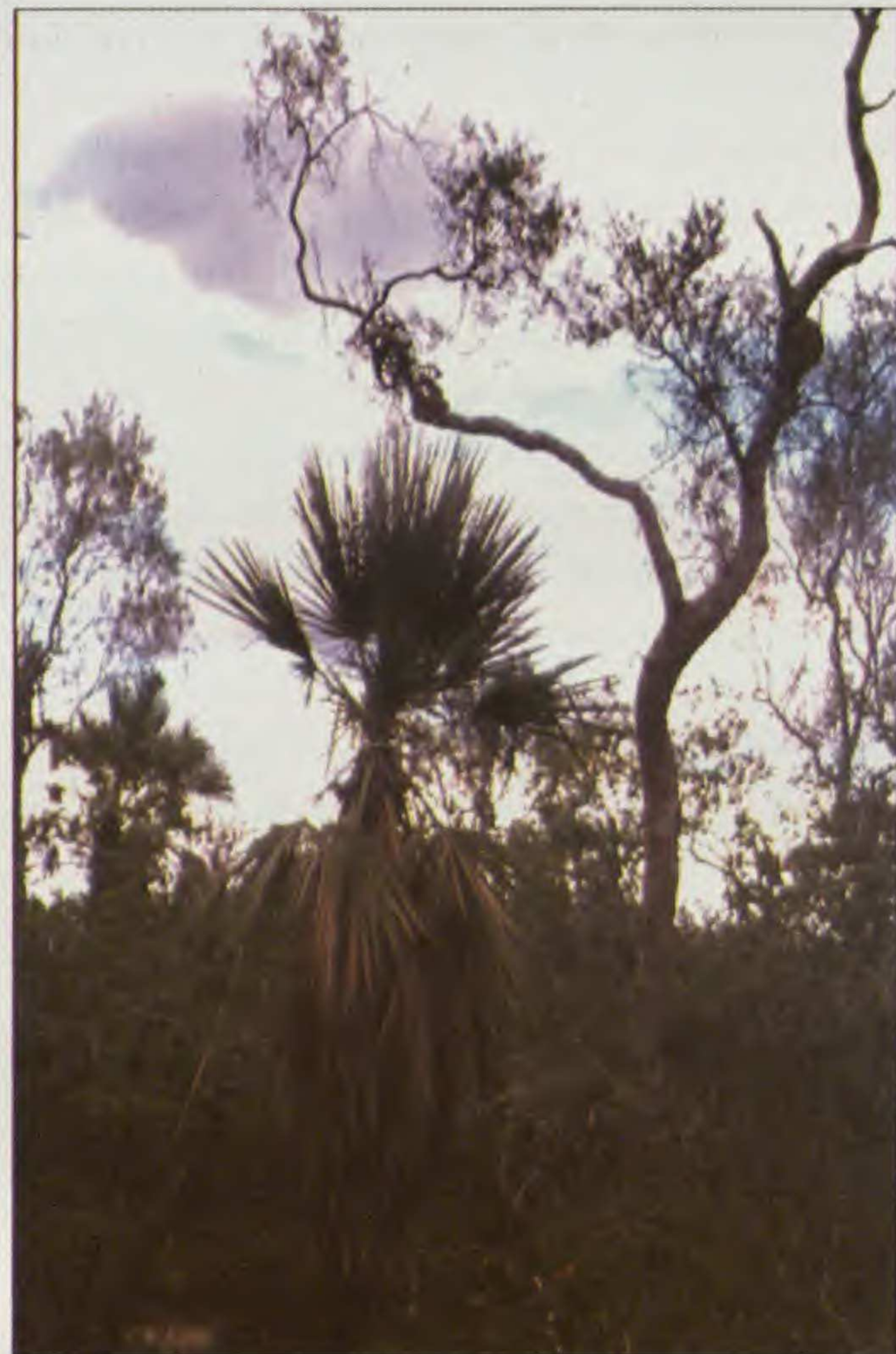
Fig. 4. En paisajes más secos y espinosos del Gran Chaco, Trithrinax schizophylla , que también tolera inundaciones estacionales como en el departamento de Santa Cruz.

total inventariada al presente para esta región. Cuatro especies endémicas es el aporte de Bolivia a la región neotropical, incluyendo un género endémico.